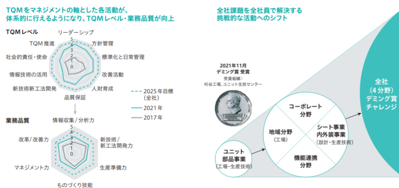
デミング賞獲得活動を通じたTQM推進の自律化(刈谷工場、ユニット生技センター)

このように、デミング賞チャレンジのための各分野の強化により、図らずも優位性は強化されていくと考えられる。